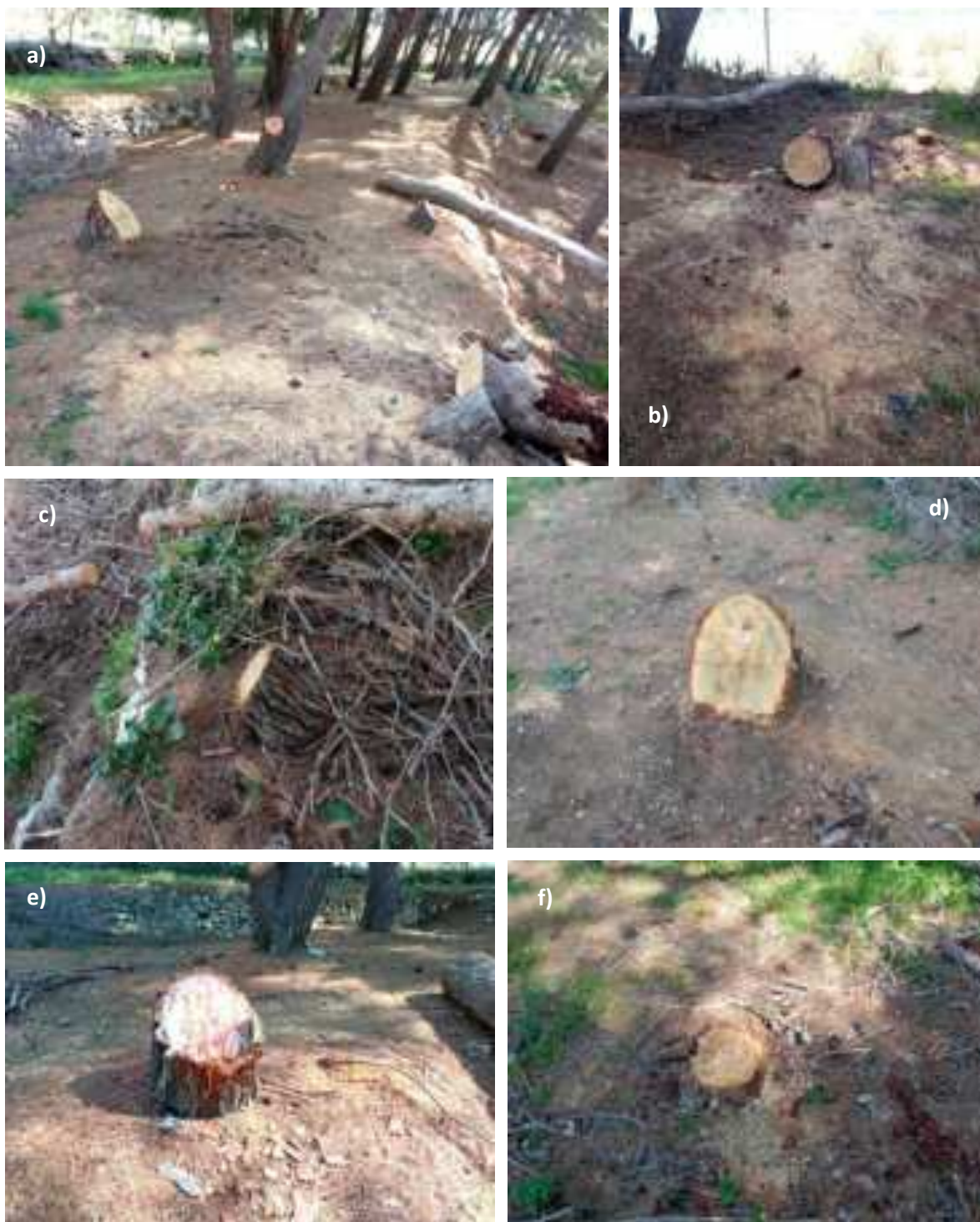
Slika 6. Srušena borova stabla ispiljena do panja, stanje 28.03.2021., a) prikaz devastacije sjevernog dijela borove šume, b), c), d), e) i f) prikaz pojedinačnih stabala ispiljenih do panja.

04.12.2021. godine ustanovljeno je prevrtanje jednog osušenog, prethodno zarezanog stabla na sjevernom dijelu pod nasadom borove šume (vidi Sliku 7 a). Na preostalom području pod nasadom borove šume iznad plaže Kamenice, tijekom 2021. godine došlo je do sušenja i prevrtanja jednog stabla na središnjem, te još dvaju stabala na južnom dijelu borove šume (Slika 7 b).