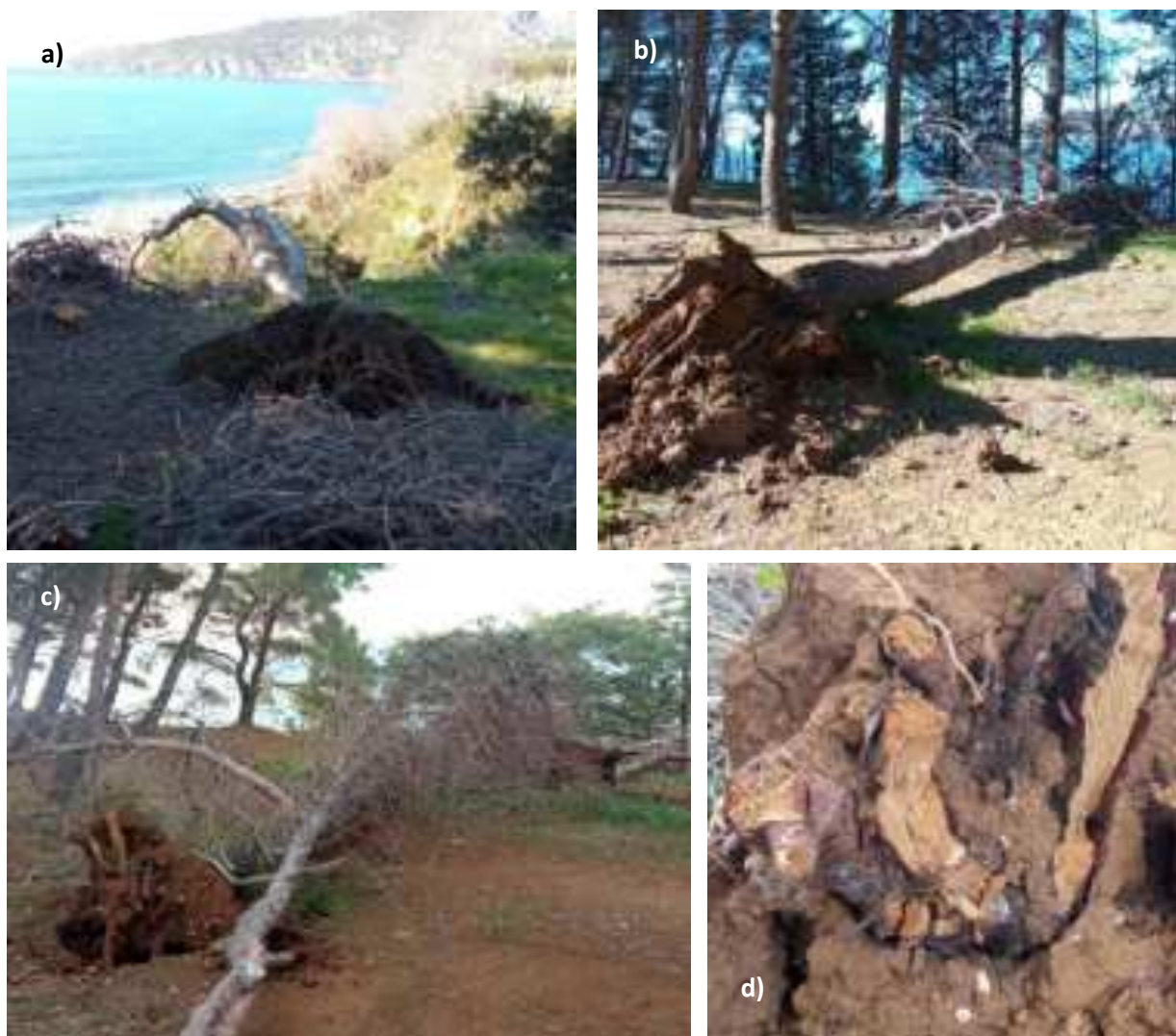
Slika 10. Osušena i srušena borova stabla tijekom 2023. godine: a) sjeverni dio borove šume, stanje 15.02.2023., b) središnji dio borove šume, stanje 15.02.2023. c) južni dio borove šume, stanje 02.12.2023. i d) detalj korjena srušenog bora, stanje 02.12.2023.

15.02.2023. godine ustanovljeno je da je došlo do sušenja još dvaju stabala, jednog na sjevernom dijelu borove šume ( Slika 10 a ), te jednog na središnjem dijelu borove šume ( Slika 10 b ). Nadalje, 02.12.2023. godine ustanovljeno je sušenje i rušenje još triju borovih stabala na južnom dijelu borove šume ( Slika 10 c ). Kao i prethodnih godina, uzrok prevrtanju borova je oslabljen korijen stabala ( vidi Sliku 10 d ).