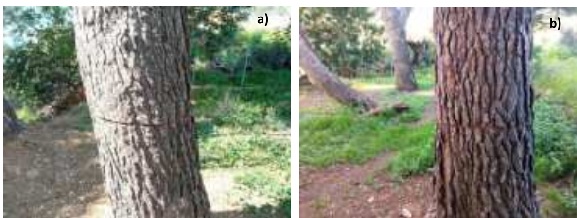
Slika 5. Primjeri borovih stabala zarezanih motornom pilom krajem 2018. godine, a) i b) stanje 28.03.2021.

Tijekom 2019. godine, na sjevernom dijelu borove šume ustanovljeno je da od 15 borova koji su prethodno zarezani motornom pilom, 7 borova pokazuje naznake pojačanog lučenja smole. U preostalom području pod borovom šumom, nekoliko mlađih stabala upućivalo je na znakove propadanja. Navedenim stablima oslabljen je korjen, uslijed čega dolazi do postepenog sušenja, nagnuća i rušenja. Sušenje i oslabljen korjen ukazuju su na moguće trovanje stabala kemijskim sredstvima.