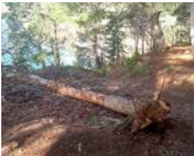
Slika 8. Osušeno i srušeno borovo stablo na južnom dijelu borove šume, stanje 11.12.2022.

Dana 11.12.2022., ustanovljeno je sušenje i prevrtanja još jednog stabla na južnom dijelu borove šume ( Slika 8 ). Nadalje, 20.12.2022. godine ustanovljeno je da su na dva veća stabla bora na sjevernom dijelu borove šume, koja su krajem 2018. godine zarezana motornom pilom, ponovno vršeni radovi sa ciljem sušenja i rušenja navedenih stabala. Naime, na navedenim stablima vršeno je uklanjanje kore u formi prstenas ciljem ubrzanja sušenja stabala ( vidi Sliku 9 ).