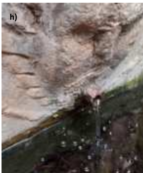
Slika 1. Rimski izvor vode na Kamenicama, a i b) stanje 28.03.2021., c i d) stanje 28. i 29. 11.2022., e) stanje 27.10.2023., f) stanje 27.09.2024., g) i h) stanje 10.01.2025. i 12.01.2025.

10.01.2025. godine ustanovljeno je da na izvorima potoka Kamenice smještenim uz stepenice pristupnog puta plaži, voda izvire odgovarajućim protokom ( vidi Sliku 2 d ). Dakle, za razliku od stanja zabilježenog prošle i pretprošle zime kada je na navedenim izvorima voda isticala vrlo slabim do zanemarivim protokom ( vidi Slike 2 b i c ), ustanovljeno nalikuje stanju zabilježenom 2021. godine ( vidi Sliku 2 a ), kada su nakon nekoliko godina ponovno u funkciji i izvori potoka Kamenice smješteni u nastavku stepenica na pristupnom putu prema javnoj plaži. Navedeno je rezultat količine oborina, intenziteta crpljenja otočkog vodonosnika, ali i posljedica neodržavanja izvora. Naime, zbog neodržavanja izvora dolazi do čestog začepljenja cijevi izvora uslijed nanosa sitnozrnatog koherentnog materijala.