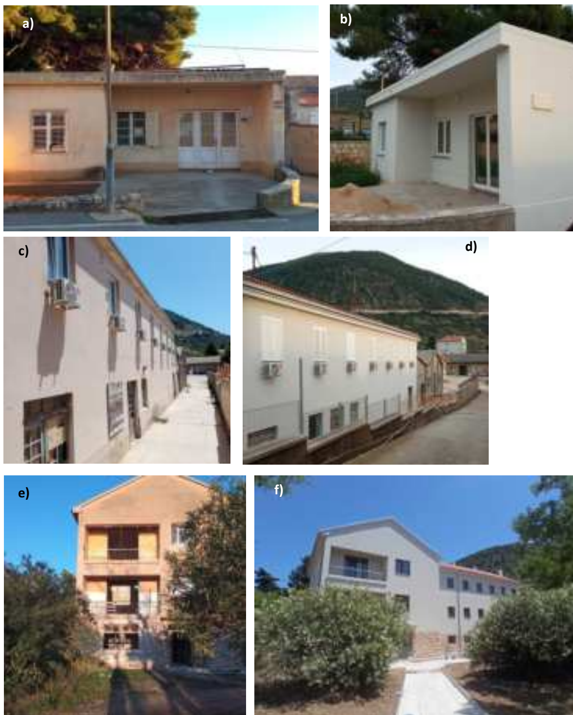
Slika 16. Objekti nekadašnje tvornice za preradu ribe Neptun: a) porta, stanje 14.02.2024., b) porta, stanje, 10.01.2025., c) upravna zgrada, stanje 16.06.2024., d) upravna zgrada, stanje 10.01.2025., e) Radnički dom, stanje 14.02.2024., f) Radnički dom, stanje 16.06.2024.

upravne zgrade (vidi Sliku 16). Također, prostor nekadašnje tvornice je od početka ljeta 2024. godine u potpunosti ograđen i više se ne koristi za održavanje brodova lokalnih ribara. Prilaz plaži Mlin kopnenim putem kroz područje nekadašnje tvornice Neptun, više nije moguć (Slika 17).