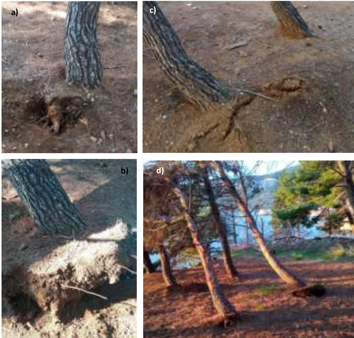
Slika 11. Osušena i prevrnutna borova stabla tijekom 2024. godine na južnom dijelu borove šume: a) i b) stanje 27.09.2024. c i d) stanje 10.01.2025. godine.

Od kraja 2018. godine do datuma objavljivanja ovog izvješća, u području borove šume uz javnu plažu Kamenice srušeno je 22 borovih stabala. Najveći broj borovih stabala, 10, srušen je na sjevernom dijelu borove šume. Navedena stabla rušena su zarezivanjem motornom pilom, uklanjanjem kore i/ili piljenjem do panja. Zarezivanje stabala bora motornom pilom, kao i uklanjanja kore u formi prstena oko stabla je praksa koja se koristi kako bi se namjerno potaklo lučenje smole bora. Pojačano lučenje smole dovodi do postupnog sušenja, te u konačnici do rušenja stabala. Srušena stabla utječu i na zdrava stabla u okolini budući da doprinose brojnosti nametnika u šumskom području. U središnjem i južnom dijelu borove šume zabilježeno je sušenje i rušenje 12 stabala. Navedena stabla karakterizirao je oslabljen je korjen, uslijed čega dolazi do postepenog sušenja, nagnuća i rušenja. Sušenje i oslabljen korjen ukazuju na moguće namjerno trovanje stabala kemijskim sredstvima.