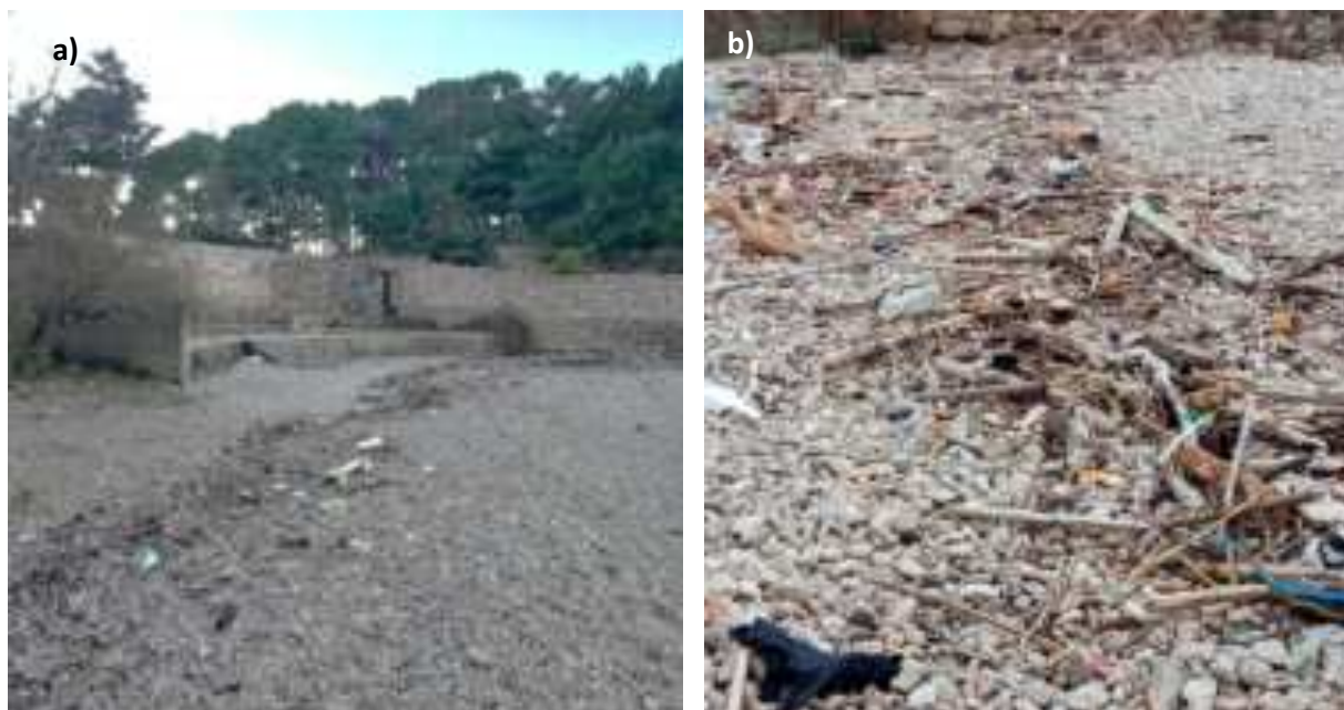
Slika 20. Plaža Grandovac, a) stanje 30.12.2024. i b) stanje 29.01.2025.

Tijekom 2024. godine članovi Udruge Pomalo posjećivali su javnu plažu Grandovac. Na javnoj plaži Grandovac često se nalazi značajna količina plastičnog otpada koji nanosi more ( vidi Sliku 20 ). Time se javlja potreba da se na javnoj plaži Grandovac postave kante za prikupljanje otpada.