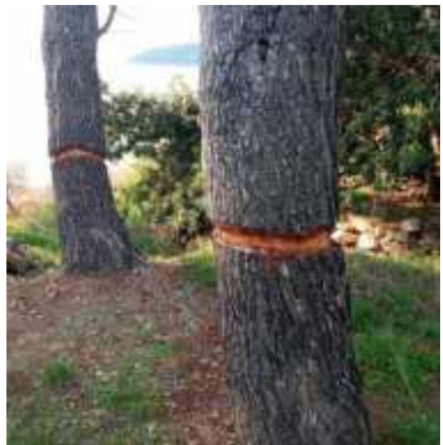
Slika 9. Borova stabla na sjevernom dijelu borove šume s uklonjenom korom u formi prstena, stanje 20.12.2022.