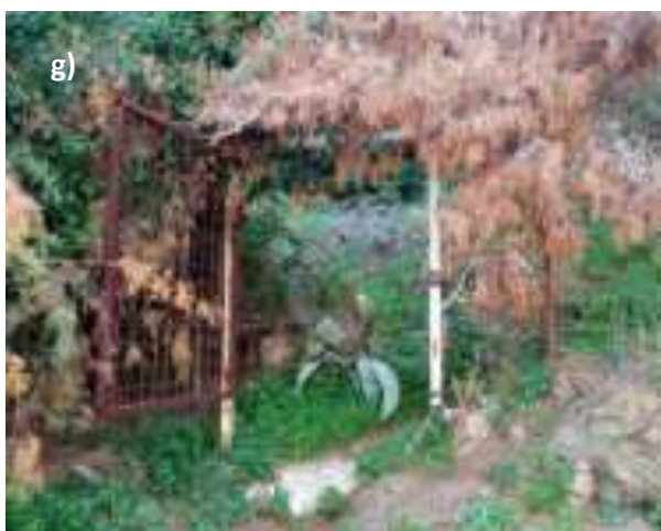
Slika 4. Ograde na javnoj plaži Kamenice: a) južni ulaz, stanje 06.11.2021., b) istočni ulaz, stanje 06.11.2021., c) južni ulaz, stanje 14.06.2022., d) istočni ulaz, stanje 20.12.2022., e) južni ulaz, stanje 10.01.2025., f) istočni ulaz, stanje 27.09.2025 i g) istočni ulaz stanje 10.01.2025.