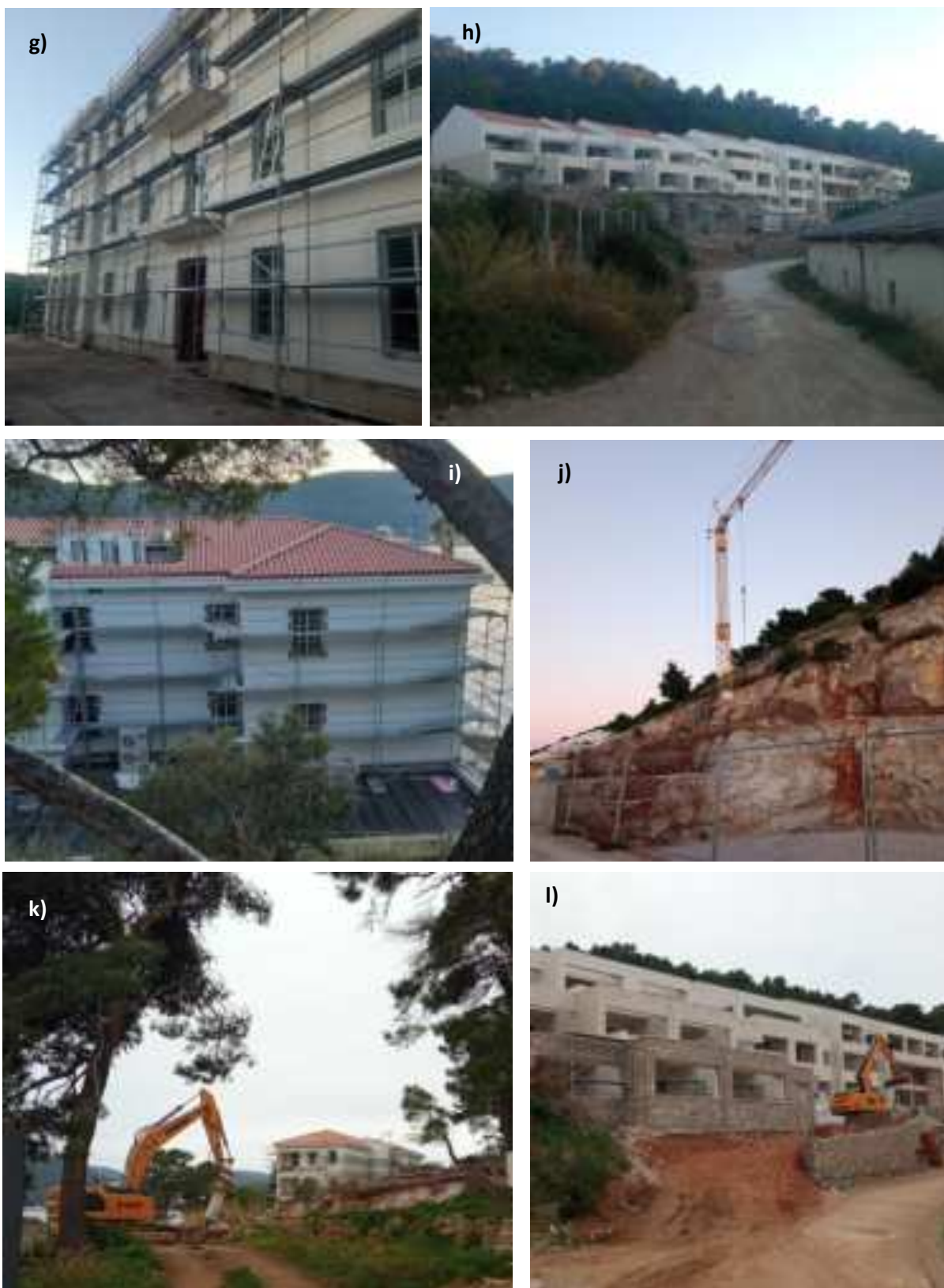
Slika 19. Češka vila: a) stanje 01.10.2020., b) stanje 22.12.2021., c i d) stanje 15.09.2022., e) 25.11.2023. i f) stanje 07.11.2023., g, h, i j) stanje 30.12.2024., k) i l) stanje 29.01.2025.