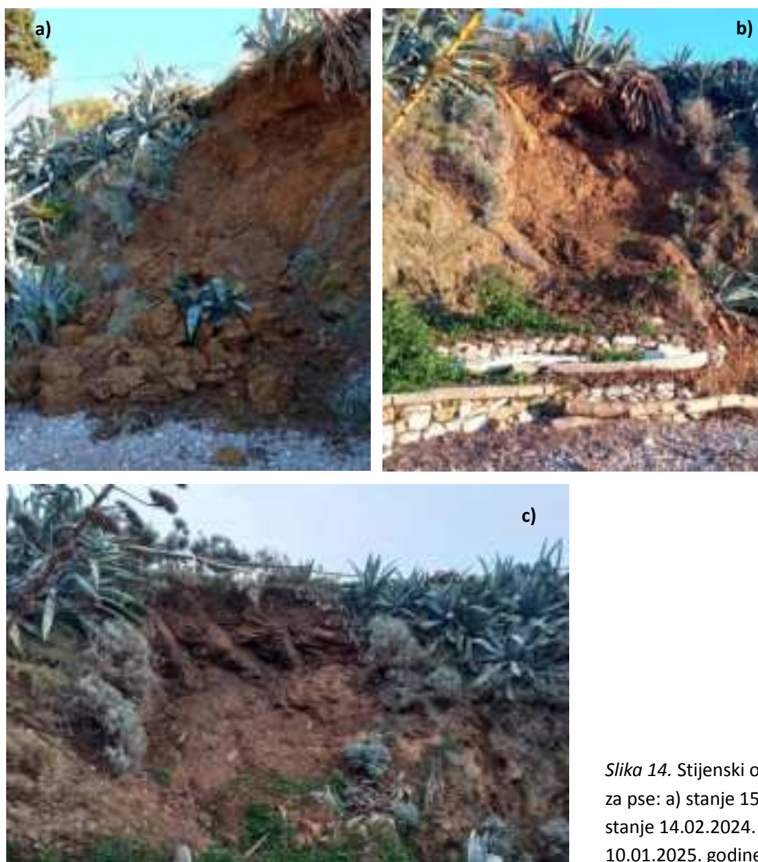
Slika 14. Stijenski odron na plaži za pse: a) stanje 15.02.2023., b) stanje 14.02.2024. c) stanje 10.01.2025. godine.

15.02. 2023. godine na južnom dijelu plaže za pse ustanovljen je manji stijenski odron neposredno podno pristupnog puta sa betonskom podlogom ( vidi Sliku 14 a ). Pojava stijenskog odrona ukazuje na premašene uvjete nosivosti pristupnog puta. Stijenski odron nemoguće je sanirati vraćanjem u prvobitno stanje, čime je počinjena trajna šteta prirodnih geomorfoloških karakteristika plaže. Tijekom ljeta 2023. Godine, volonteri Green island i Goulash festivala proveli su djelomičnu stabilizaciju odrona gradnjom suhozida podno stijenskog odrona ( vidi Sliku 14 b ). Stanje stijenskog odrona zabilježeno 10.01.2025. prikazano je Slikom 14 c . Bez daljnih radova stabilizacije, u narednom periodu moguće je progresivno širenje loma stijenskog materijala pod pristupnom cestom, koji u trenutnom stanju zahvaća potkop dubine cca 1 m ispod betonske podloge.