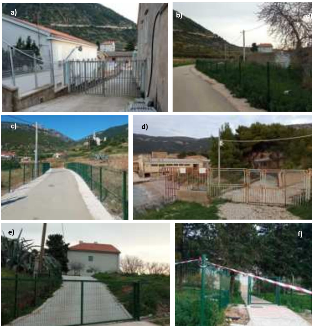
Slika 17. Ograde zemljišta nekadašnje tvornice Neptun, a) sjeverni ulaz, stanje 10.01.2025., b) ograde uz obilaznu cestu, stanje 10.01.2025. c) ograde uz obilaznu cestu, stanje 17.06.2024., d) južni ulaz, stanje 10.01.2025, e) i f) ulazi u radnički dom, stanje 10.01.2025.