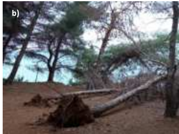
Slika 7. Osušena i srušena borova stabla, a) sjeverni dio borove šume, stanje 04.12.2021., i b) južni dio borove šume, stanje 04.12.2021.

Dana 11.12.2022., ustanovljeno je sušenje i prevrtanja još jednog stabla na južnom dijelu borove šume ( Slika 8 ). Nadalje, 20.12.2022. godine ustanovljeno je da su na dva veća stabla bora na sjevernom dijelu borove šume, koja su krajem 2018. godine zarezana motornom pilom, ponovno vršeni radovi sa ciljem sušenja i rušenja navedenih stabala. Naime, na navedenim stablima vršeno je uklanjanje kore u formi prstenas ciljem ubrzanja sušenja stabala ( vidi Sliku 9 ).