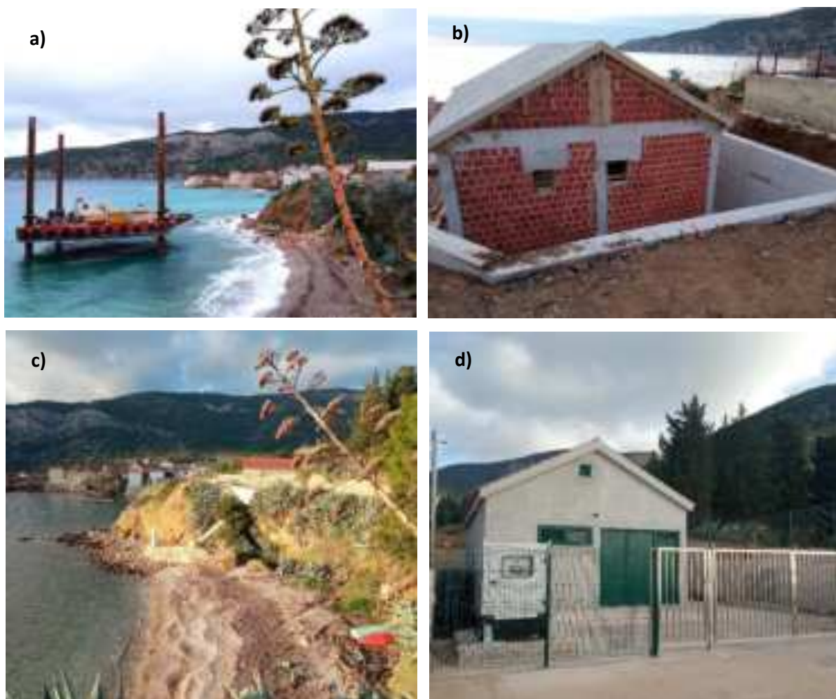
Slika 13. Radovi na izgradnji kanalizacijske infrastrukture: a) polaganje podmorskog ispusta, stanje 04.12.2021., b) objekt sustava za pročišćavanje otpadnih voda, stanje 04.12.2021., c) plaža za pse, stanje 20.12.2022., d) objekt sustava za pročišćavanje otpadnih voda, stanje 20.12.2022.

U jesen 2020. godine započeti su podvodni radovi iskopa uz javnu plažu za pse. Cilj radova je instalacija cijevi kanalizacijske infrastrukture grada Komiže, tj. podmorskog ispusta i objekta sustava za pročišćavanje otpadnih voda uz južni dio bivše tvornice Neptun. Tijekom 2022. godine, radovi na objektu navedenog sustava privedeni su kraju ( vidi Sliku 13 ). Tijekom ljeta, u navedenom području širi se značajan smrad fekalija, čime je umanjena ambijentalna vrijednost cijelokupnog područja.