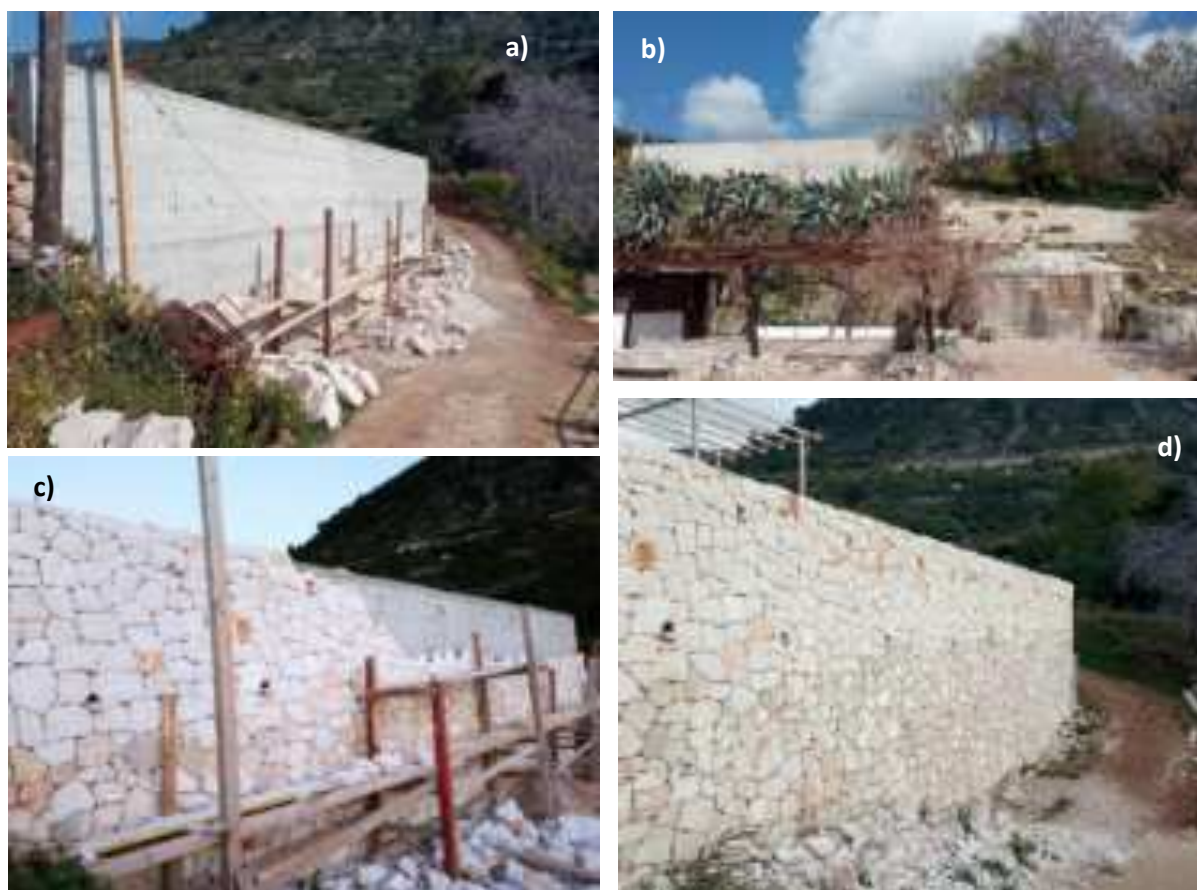
Slika 12. Zid uz pristupni put prema plaži Kamenice: a i b) stanje 28.03.2021., c) stanje 4.12.2021. i d). stanje 20.12.2022.

Krajem 2020. godine na zemljištu uz pristupni put prema plaži Kamenice, neposredno iznad rimskog izvora, izvršeno je uklanjanje postojećeg potpornog zida u formi suhozida. Na istoj lokaciji, početkom 2021. godine izvedena je izgradnja armirano betonskog potpornog zida tlocrtnog L profila ( Slika 12 a i b ). Sredinom 2022. godine armirano betonski potporni zid obložen je kamenim pločama ( Slika 12 c i d ). 05.08. 2022. na navedenom zidu pojavio se grafit nepoznatog počinitelja. Navedeni grafit je naknadno uklonjen. Udruga Pomalo navedeni čin štete na privatnoj imovini smatra neprimjerenim.