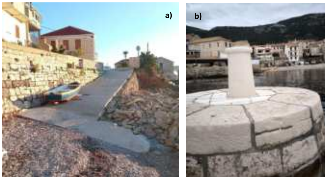
Slika 15. Plaže Jurkovicica, Žanićevo i Kalafotovo: a) izgrađena rampa sa betonskom podlogom na plaži Jurkovicica, stanje: 14.02.2024., b) obnova kamenih koluni u moru uz plaže Žanićevo i Kalafotovo, stanje 21.01.2025.

Početkom 2024. godine na plaži Jurkovicica ustanovljena je provedba uređenja nekadašnje zemljane rampe izgradnjom betonske podloge ( vidi Sliku 15 a ). Također, izgradene su nove stepenice kojima je omogućen pristup omanjem gatu između istezališta i plaže. Tijekom 2024. godine ustanovljena je provedba obnove kamenih koluni u moru uz plaže Žanićevo i Kalafotovo ( vidi Sliku 15 b ).