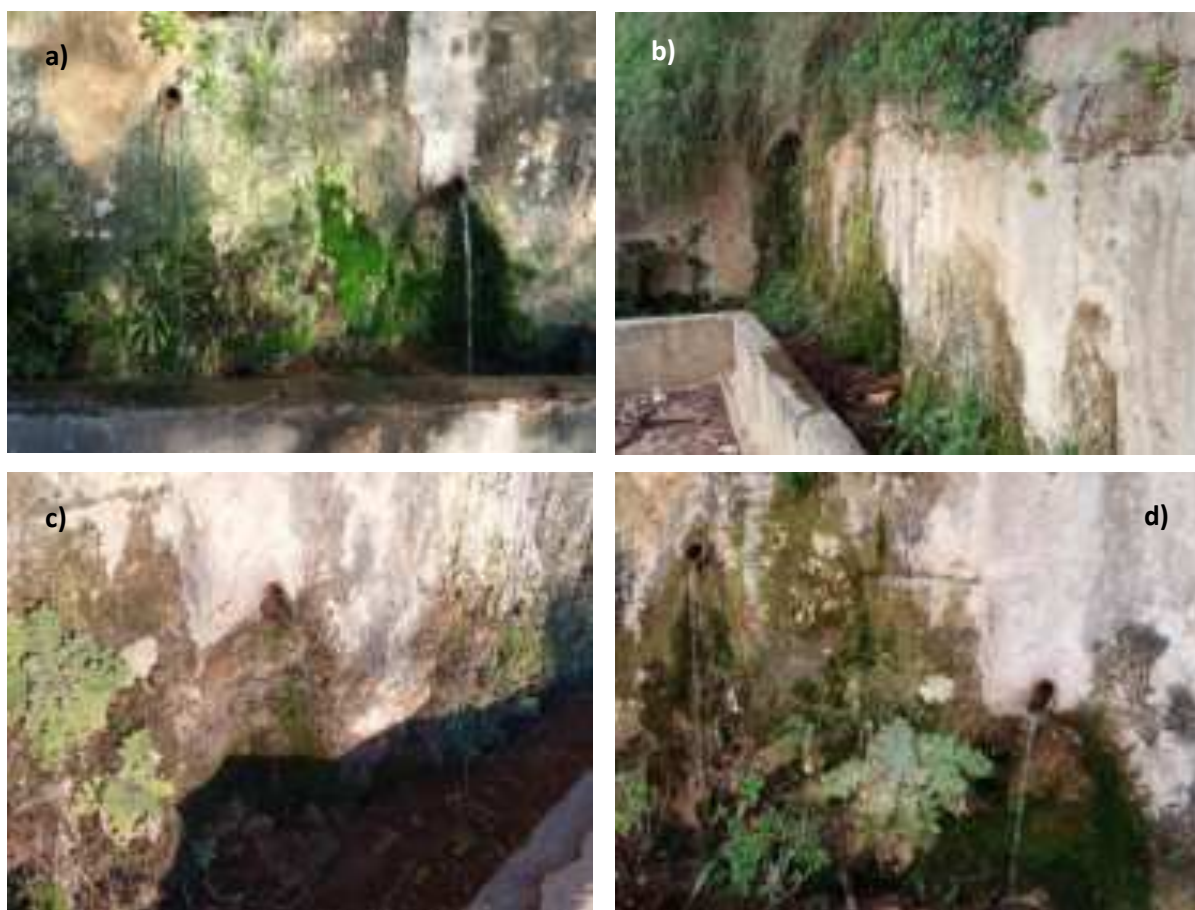
Slika 2. Izvori potoka Kamenice uz prilazni put plaži, a) stanje 04.12.2021, b) stanje 20.12.2022., c) stanje 14.02.2024. i d) stanje 10.01.2025. godine.

Rimski izvor (Slika 1), kao i izvori potoka Kamenice smješteni u nastavku stepenica na pristupnom putu prema javnoj plaži Kamenice (Slika 2.), su niz godina u vrlo lošem stanju, te smatramo da je nužno razmotriti odgovarajuće mjere njihove zaštite i obnove. Posebnu pozornost potrebno je obratiti na održavanje propusnosti izvora i odvoda, kao i na stanje kamene konstrukcije rezervoara rimskog izvora koja je dugi niz godina u izrazito lošem stanju. Budući da je dana 27.10.2023. i 27.09.2024. u bazenu podno rimskog izvora zabilježena razina vode iznad cijevi samog izvora, izgledno je očekivati sniženje kvalitete izvorske vode. U skladu sa navedenim, potrebno je izvršiti testiranje izvorske vode i provjeru njene prikladnosti za piće.