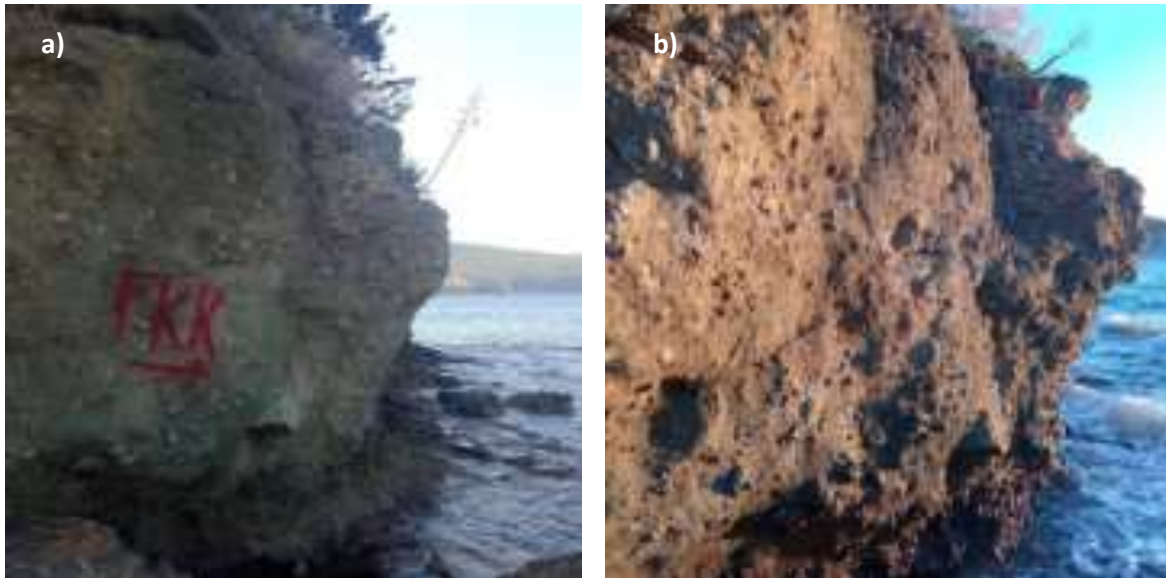
Slika 3. Devastacija prirodnih geomorfoloških karakteristika plaže Kamenice, a) stanje 18.07.2023. i b) stanje 14.2.2024.