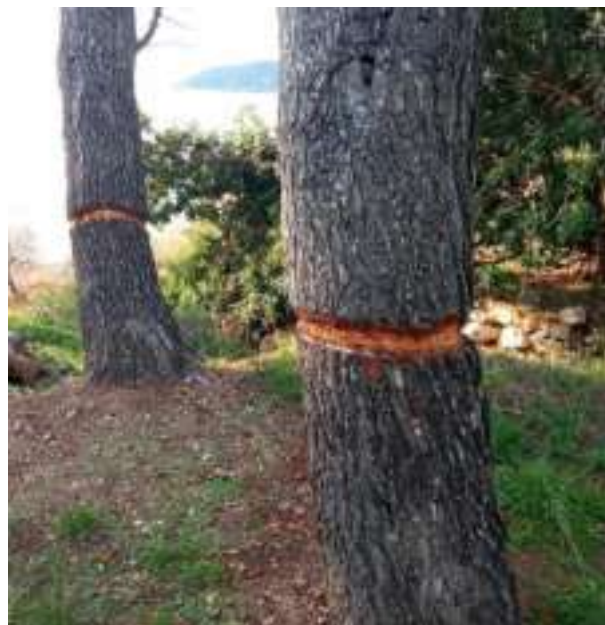
Slika 9. Borova stabla na sjevernom dijelu borove šume s uklonjenom korom u formi prstena, stanje 20.12.2022.