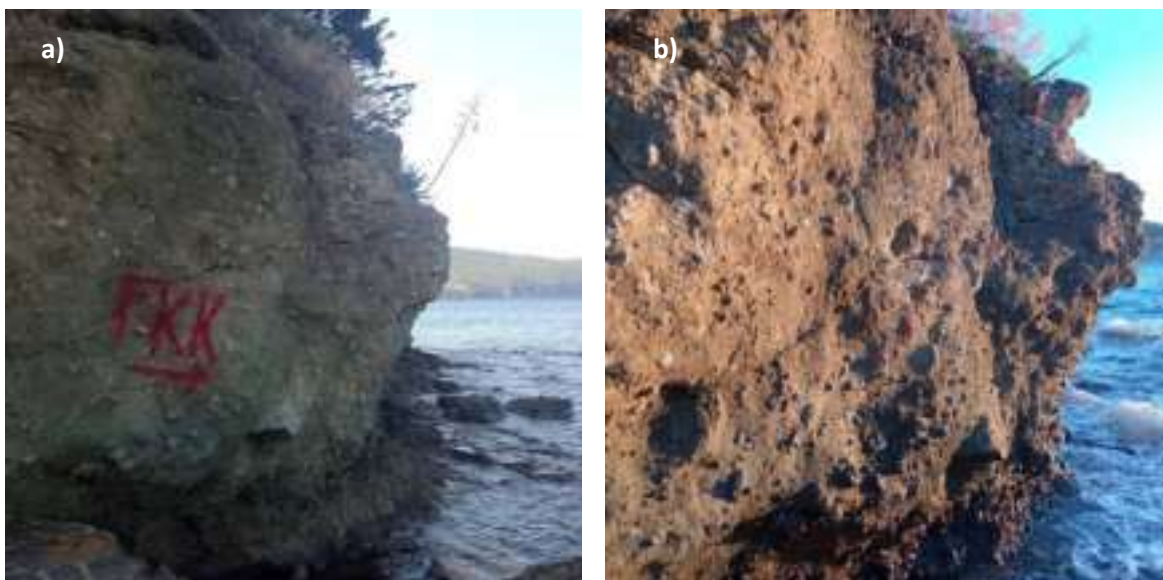
Slika 3. Devastacija prirodnih geomorfoloških karakteristika plaže Kamenice, a) stanje 18.07.2023. i b) stanje 14.2.2024.