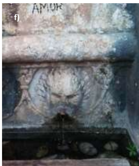
Slika 1. Rimski izvor vode na Kamenicama, a i b) stanje 28.03.2021., c i d) stanje 28. i 29. 11.2022., e) stanje 27.10.2023. i f) stanje 14.02.2024.