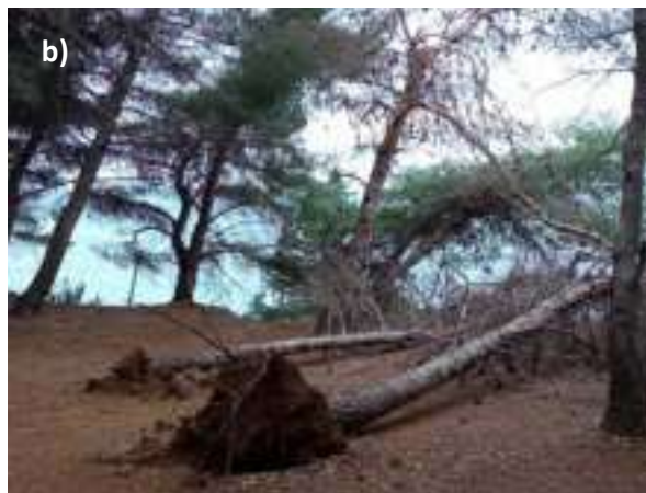
Slika 7. Osušena i srušena borova stabla, a) sjeverni dio borove šume, stanje 04.12.2021., i b) južni dio borove šume, stanje 04.12.2021.

Dana 11.12.2022., ustanovljeno je sušenje i prevrtanja još jednog stabla na južnom dijelu borove šume (Slika 8). Nadalje, 20.12.2022. godine ustanovljeno je da su na dva veća stabla bora na sjevernom dijelu borove šume, koja su krajem 2018. godine zarezana motornom pilom, ponovno vršeni radovi sa ciljem sušenja i rušenja navedenih stabala. Naime, na navedenim stablima vršeno je uklanjanje kore u formi prstenas ciljem ubrzanja sušenja stabala (vidi Sliku 9).