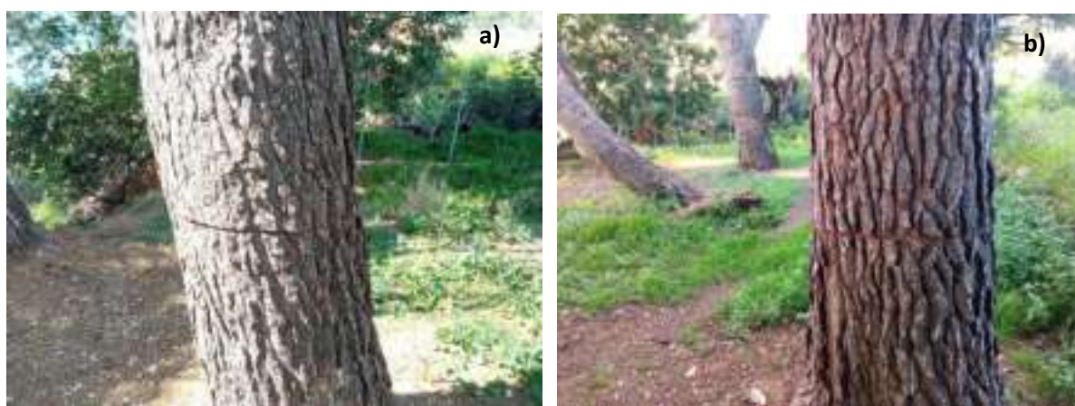
Slika 5. Primjeri borovih stabala zarezanih motornom pilom krajem 2018. godine, a) i b) stanje 28.03.2021.

Tijekom 2019. godine, na sjevernom dijelu borove šume ustanovljeno je da od 15 borova koji su prethodno zarezani motornom pilom, 7 borova pokazuje naznake pojačanog lučenja smole. U preostalom području pod borovom šumom, nekoliko mlađih stabala upućivalo je na znakove propadanja. Navedenim stablima oslabljen je korjen, uslijed čega dolazi do postepenog sušenja, nagnuća i rušenja. Sušenje i oslabljen korjen ukazuju su na moguće trovanje stabala kemijskim sredstvima.