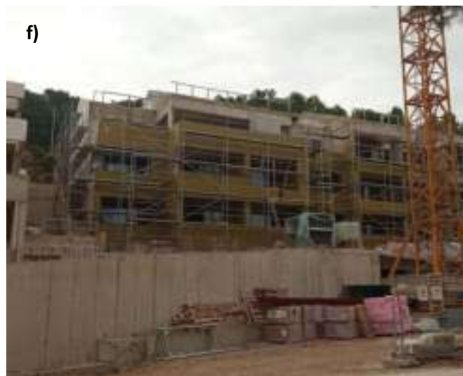
Slika 15. Češka vila: a) stanje 01.10.2020., b) stanje 22.12.2021., c i d) stanje 15.09.2022., e) 25.11.2023. i f) stanje 07.11.2023.