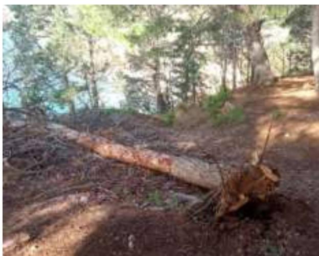
Slika 8. Osušeno i srušeno borovo stablo na južnom dijelu borove šume, stanje 11.12.2022.

Dana 11.12.2022., ustanovljeno je sušenje i prevrtanja još jednog stabla na južnom dijelu borove šume (Slika 8). Nadalje, 20.12.2022. godine ustanovljeno je da su na dva veća stabla bora na sjevernom dijelu borove šume, koja su krajem 2018. godine zarezana motornom pilom, ponovno vršeni radovi sa ciljem sušenja i rušenja navedenih stabala. Naime, na navedenim stablima vršeno je uklanjanje kore u formi prstenas ciljem ubrzanja sušenja stabala (vidi Sliku 9).