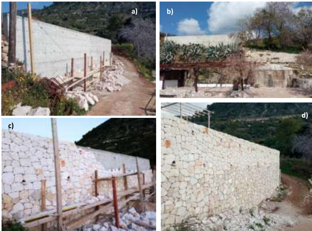
Slika 11. Zid uz pristupni put prema plaži Kamenice: a i b) stanje 28.03.2021., c) stanje 4.12.2021. i d). stanje 20.12.2022.