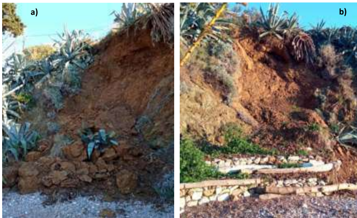
Slika 13. Stijenski odron na plaži za pse: a) stanje 15.02.2023., b) stanje 14.02.2024.