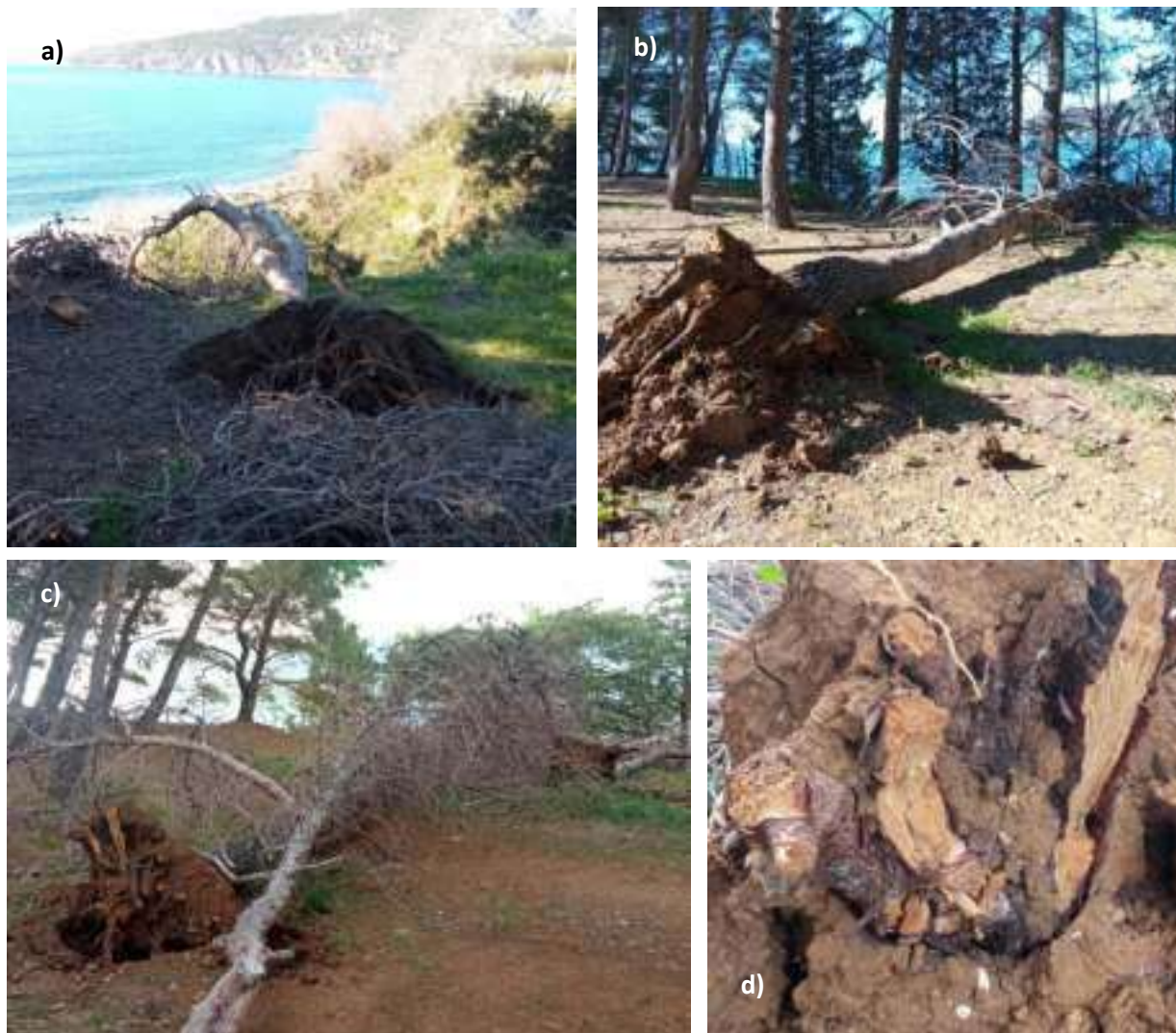
Slika 10. Osušena i srušena borova stabla tijekom 2023. godine: a) sjeverni dio borove šume, stanje 15.02.2023., b) središnji dio borove šume, stanje 15.02.2023. c) južni dio borove šume, stanje 02.12.2023. i d) detalj korjena srušenog bora, stanje 02.12.2023.

15.02.2023. godine ustanovljeno je da je došlo do sušenja još dvaju stabala, jednog na sjevernom dijelu borove šume ( Slika 10 a ), te jednog na središnjem dijelu borove šume ( Slika 10 b ). Nadalje, 02.12.2023. godine ustanovljeno je sušenje i izvrtanje još triju borovih stabala na južnom dijelu borove šume ( Slika 10 c ). Kao i prethodnih godina, uzrok prevrtanju borova je oslabljen korijen stabala ( vidi Sliku 10 d ).