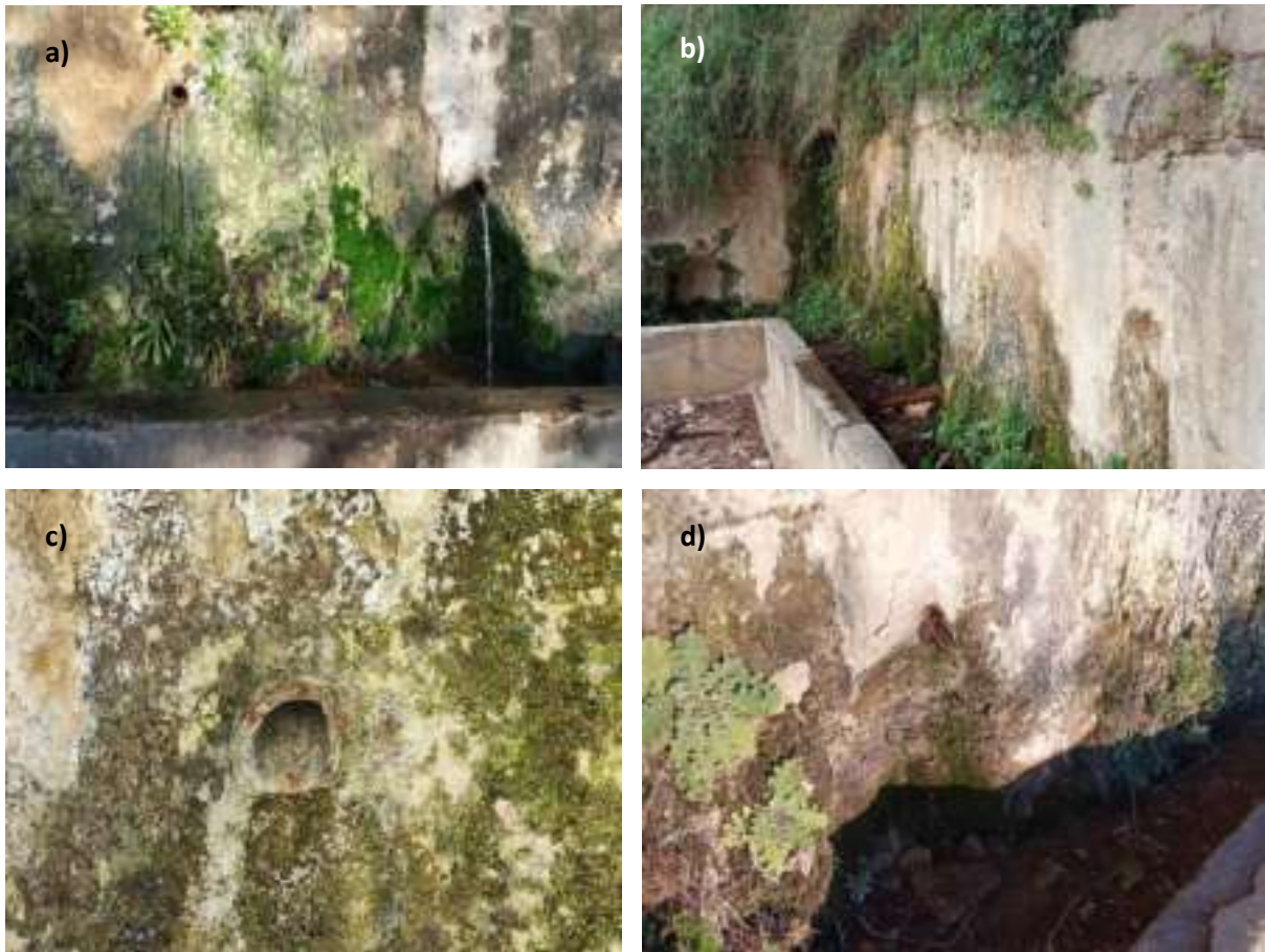
Slika 2. Izvori potoka Kamenice uz prilazni put plaži, a) stanje 04.12.2021, b) stanje 20.12.2022. i c) stanje 27.10.2023. i d) stanje 14.02.2024. godine.

Rimski izvor ( Slika 1 ), kao i izvori potoka Kamenice smješteni u nastavku stepenica na pristupnom putu prema javnoj plaži Kamenice ( Slika 2. ), su niz godina u vrlo lošem stanju, te smatramo da je nužno razmotriti odgovarajuće mjere njihove zaštite i obnove. Posebnu pozornost potrebno je obratiti na održavanje propusnosti izvora i odvoda, kao i na stanje kamene konstrukcije rezervoara rimskog izvora koja je dugi niz godina u izrazito lošem stanju. Budući da je dana 27.10.2023. u bazenu podno rimskog izvora zabilježena razina vode iznad cijevi samog izvora, izgledno je za očekivati sniženje kvalitete izvorske vode. U skladu sa navedenim, potrebno je izvršiti testiranje izvorske vode i provjeru njene prikladnost za piće.