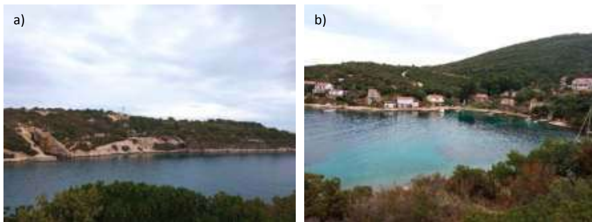
Slika 14. Lokacija izgradnje marine Parja-Rogačić, stanje 26.12.2021.: a) uvala Parja i b) uvala Rogačić.

U periodu od 05.10. do 04.11.2023. godine održana je javna rasprava o prijedlogu Urbanističkog plana uređenja poslovne zone Parja, prijedlogu Urbanističkog plana uređenja luke otvorene za javni promet i luke nautičkog turizma Parja – Rogačić, kao i prijedlogu Strateške studije utjecaja navedenih prostornih zahvata na okoliš. Udruga pomalo nije sudjelovala u javnoj raspravi o prijedlogu nove prostorne dokumentacije zbog nedostatka sredstava.