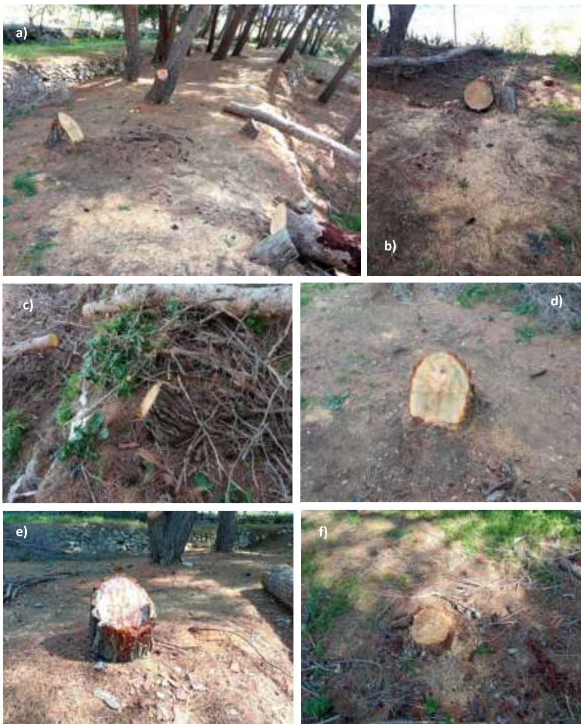
Slika 6. Srušena borova stabla ispiljena do panja, stanje 28.03.2021., a) prikaz devastacije sjevernog dijela borove šume, b), c), d), e) i f) prikaz pojedinačnih stabala ispiljenih do panja.

04.12.2021. godine ustanovljeno je prevrtanje jednog osušenog, prethodno zarezanog stabla na sjevernom dijelu pod nasadom borove šume (vidi Sliku 7 a). Na preostalom području pod nasadom borove šume iznad plaže Kamenice, tijekom 2021. godine došlo je do sušenja i prevrtanja jednog stabla na središnjem, te još dvaju stabala na južnom dijelu borove šume (Slika 7 b).