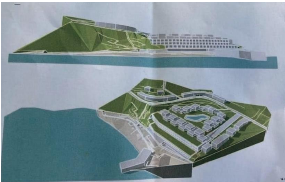
Slika 3. Studija volumena nove infrastrukture zone turističko - ugostiteljske namjene T1 (Vruja - Festival bespravne gradnje i devastacije prirode 2022).

Uz izmjene i dopune prostorno planske dokumentacije kojima se predviđaju promjene namjene i granica zone, te načina i uvjeta gradnje, izmjenom i dopunom prostorno planske dokumentacije predviđaju se i promjene na prometnoj i uličnoj mreži poput promjena trase kolno-pješačke ulice, te ukidanje poprečne pješačke ulice ( Grad Komiža 2021 ). Na osnovi dostupnih informacija o novim planskim rješenja po pitanju prometne infrastrukture, uz modifikacije trase kolno-pješačke ulice, te ukidanje poprečne pješačke ulice, razaznaje se i predviđena gradnja podzemne garaže ( Vruja - Festival bespravne gradnje i devastacije prirode 2022 ).